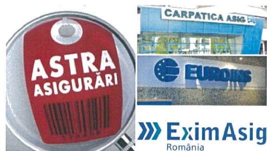
Astra, Carpatica și EuroIns dețin circa 60% din piața RCA, un lucru extrem de grav