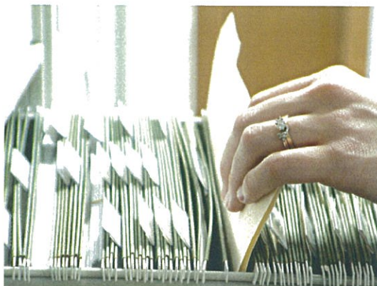
Arhivarea documentelor în 2016 - cum și cât păstrezi actele firmei